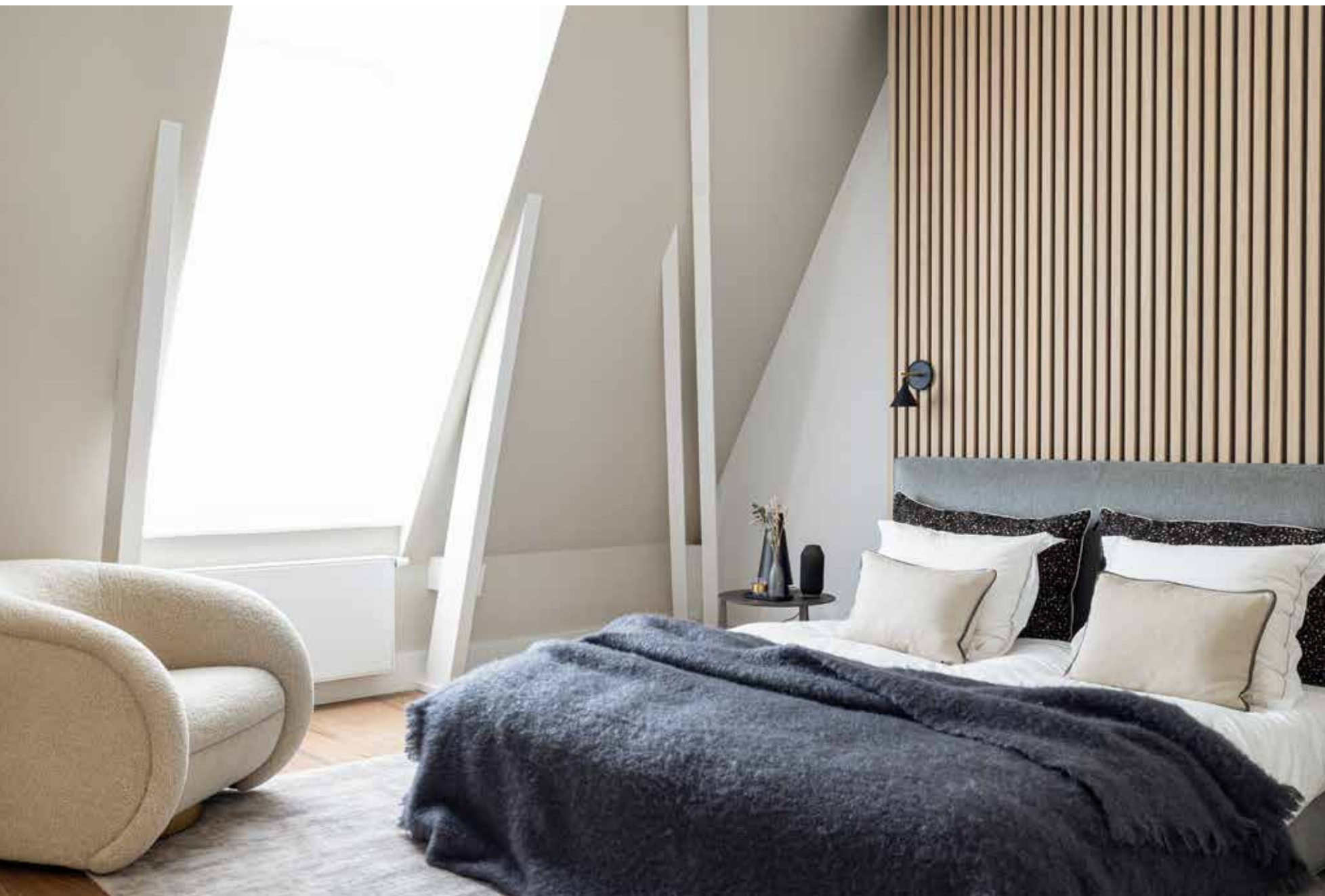
De bedwand werd ontworpen door Clairz Interior Design en gemaakt door Altivello. Het bed en de nachtkastjes zijn van Molteni&C. Vloerkleed van Ligne Pure.

‘Ik wilde een interieur met de warmte en stijl van Italiaans design, zoals ik mijn maatpakken graag draag’