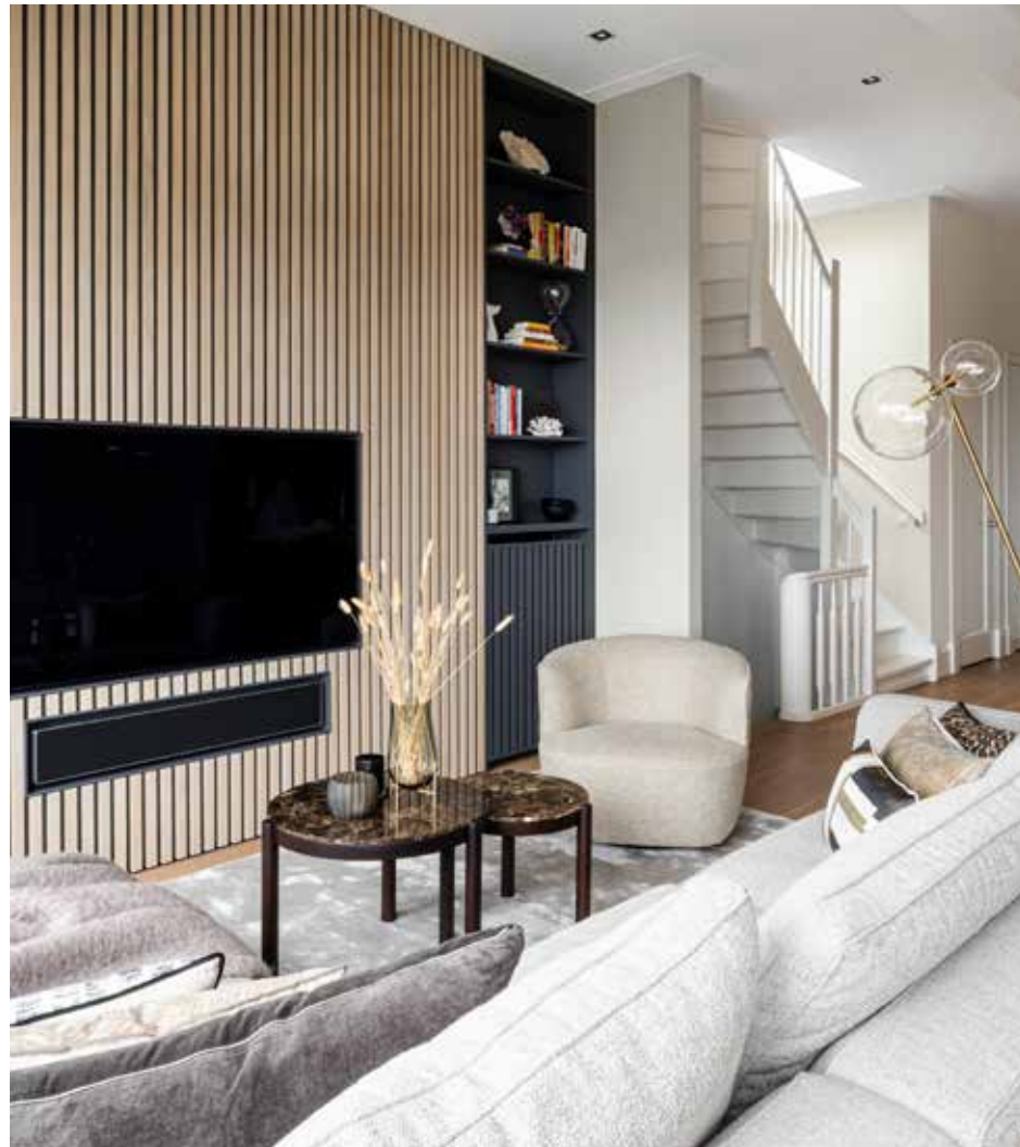
De wandkast werd ontworpen door Clairz Interior Design en gemaakt door Altivello. Bank van Molteni&C. De vloerlamp met glazen bollen is van Schwung.

'Hier thuiskomen en samenzijn is precies zoals ik gehoopt had'