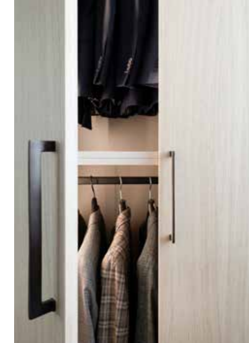
De kasten werden ontworpen door Clairz Interior Design en gemaakt door Altivello.

‘Ik wilde een interieur met de warmte en stijl van Italiaans design, zoals ik mijn maatpakken graag draag’