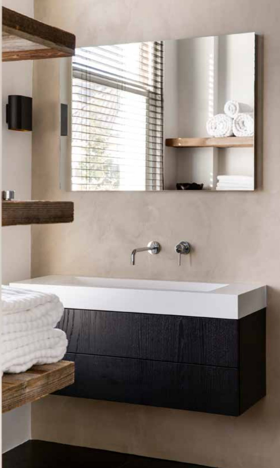
In de badkamer-en-suite een wastafel van het label Not Only White. De verlichting is type Duell van Modular. Handdoeken van Zara Home en decoratie van Micheal Verheyen.