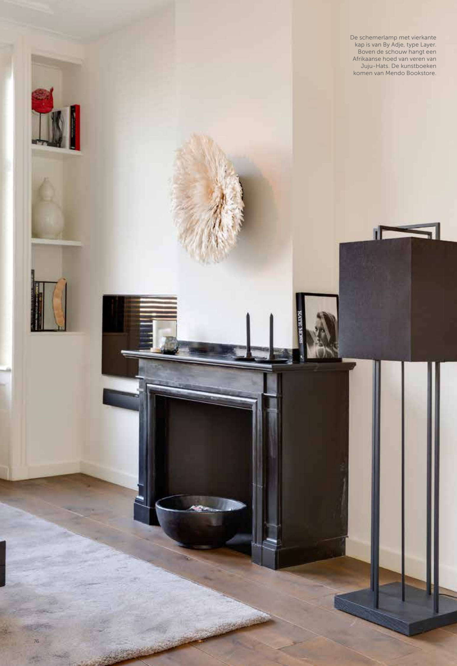
De schemerlamp met vierkante kap is van By Adje, type Layer. Boven de schouw hangt een Afrikaanse hoed van veren van Juju-Hats. De kunstboeken komen van Mendo Bookstore.