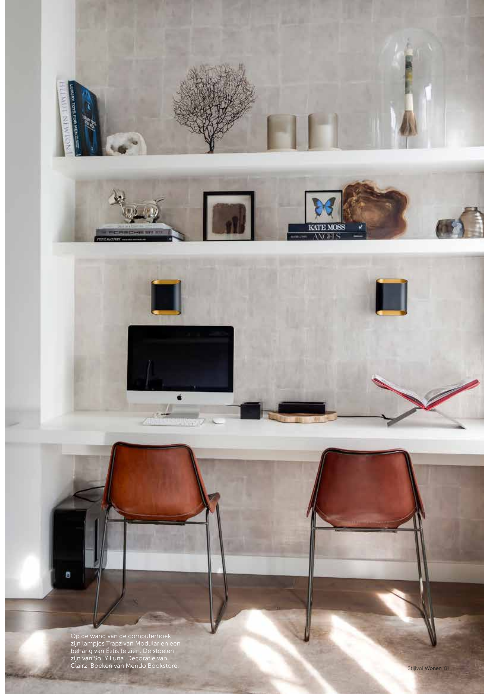
Op de wand van de computerhoek zijn lampjes Trapz van Modular en een behang van Élitis te zien. De stoelen zijn van Sol Y Luna. Decoratie van Clairz. Boeken van Mendo Bookstore.