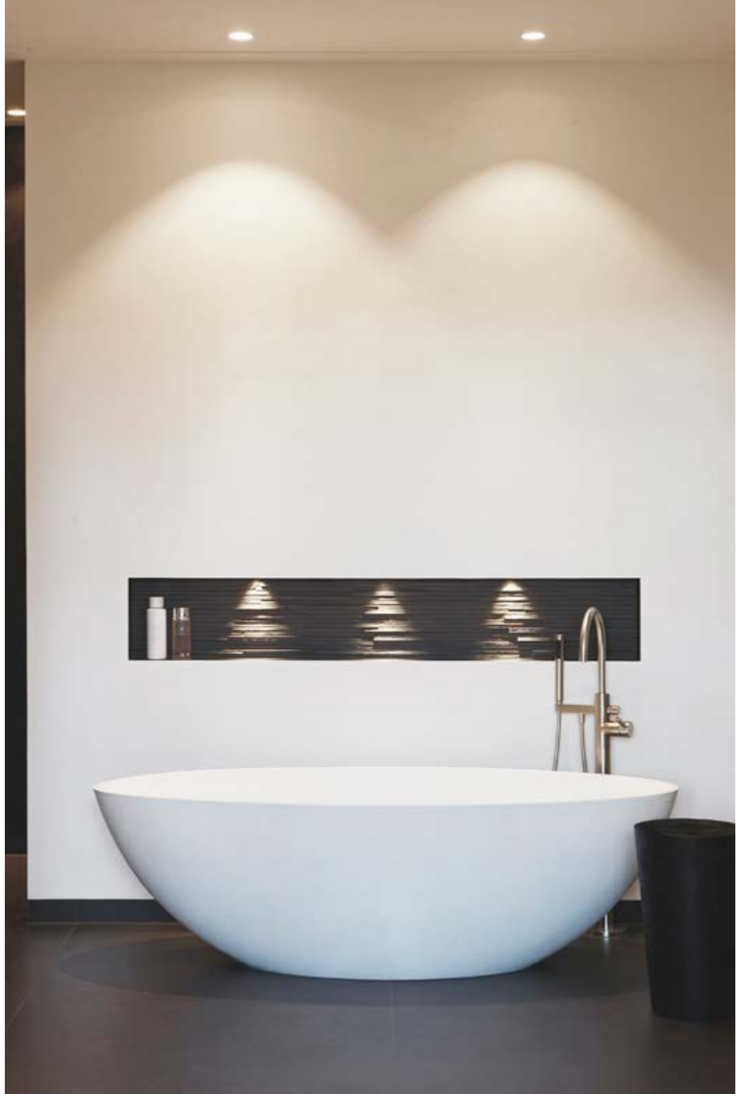
Bad, waskommen en wastafelmeubel zijn van Sjartec.