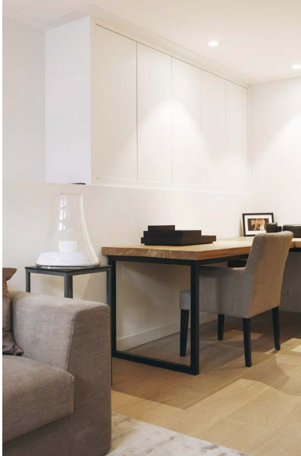
Op de slaapbank van Meridiani liggen kussens van Clairz Interior Design. Het bureau en de bijzetter werden door Clairz ontworpen. De bureaustoel is van Baan Meubelen, het tapijt van Limited Edition en de spots zijn van Modular.

“ Door materialen zoals hout, linnen en katoen te gebruiken, is de sfeer enorm gezellig